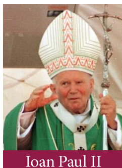
Ioan Paul II

Ac yn ôl Archesgob Cymru, Barry Morgan, 'rhoi organau yw'r ffordd mwyaf hael bosibl o roi o'r hunan.'