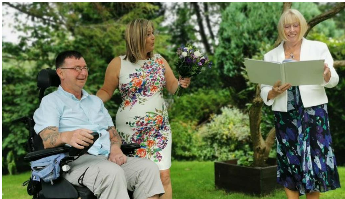
© Llyn gan Rachel Platt / humanism.org.uk

Yn dilyn y cynnydd mewn Dyneiddiaeth mae yna gynnydd yn nifer y bobl sy'n dewis cynnal seremoni heb grefydd - seremoni enwi plentyn , priodas ac angladd. Mae'n rhaid i unrhyw un sy'n arwain gwasanaethau Dyneiddiol gymhwyso i wneud hynny. Ond beth yn union yw seremoni ddyneiddiol? Sut mae gwasanaeth enwi plant dyneiddiol, a sut mae hyn yn wahanol i fedydd?