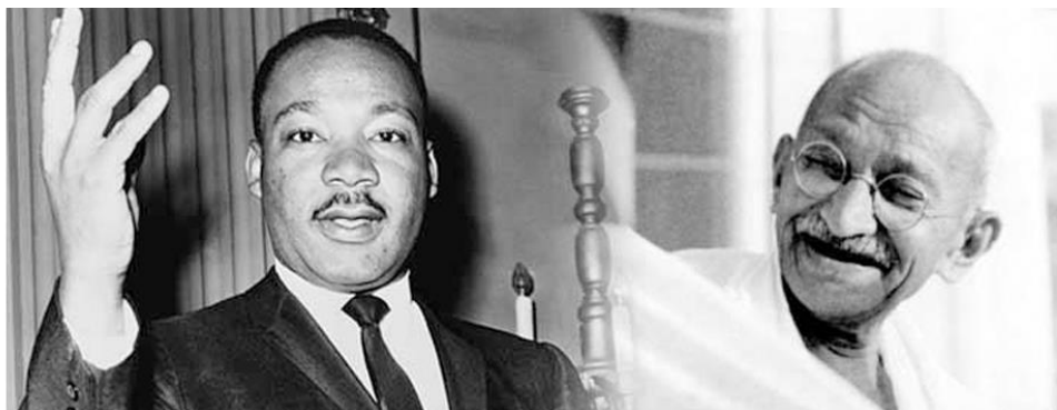
Martin Luther king / Gandhi

Gwrthododd y bocsiwr Muhammad Ali , ar sail ei gredoau Mwslimaidd, y gorchymyn i fynd i ymladd yn rhyfel Fietnam. Cafodd ei arestio a'i atal rhag bocsi a thynnwyd oddi arno pob pencampwriaeth yr oedd wedi ei ennill. Ni fu yn bocsi o gwbl am dros dair blynedd ond yn 1975 adenillodd bencampwriaeth pwysau trwm y byd pan orchfygodd George Foreman yn Kinshasa, Zaire.