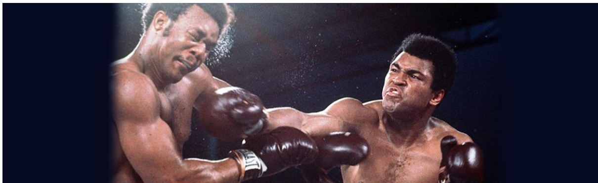
George Foreman / Muhammad Ali

crefyddol ond pan fydd polisïau gwleidyddol yn herio credoau crefyddol yna mae cwestiynau anodd iawn yn codi. Ar bwy mae crediniwr crefyddol i wrando - ar ei gydwybod crefyddol neu ar lywodraeth gwlad, ar ei Dduw neu ar y gyfraith? Os yw credinwyr crefyddol yn credu bod y llywodraeth/gwleidyddion yn gweithredu'n groes i egwyddorion crefyddol oes rheidrwydd moesol arnynt i sefyll a gwrthwynebu er mwyn creu newid er gwell? Yn sicr os edrychwn yn ôl dros hanes dyna y mae nifer fawr o gredinwyr wedi ei gredu a'i wneud. Pobl oedd yn barod i ddilyn eu cydwybod crefyddol beth bynnag oedd y gost iddyn nhw eu hunain a safiad nifer helaeth ohonynt wedi arwain at greu gwell byd. Pobl fel Dietrich Bonhoeffer, gweinidog gyda'r Eglwys Lutheraidd yn yr Almaen a ddienyddiwyd yng Ngwersyll Flossenbug ar 9fed Ebrill, 1945 am iddo wrthwynebu polisïau'r Natsïaid dan arweiniad Adolf Hitler.