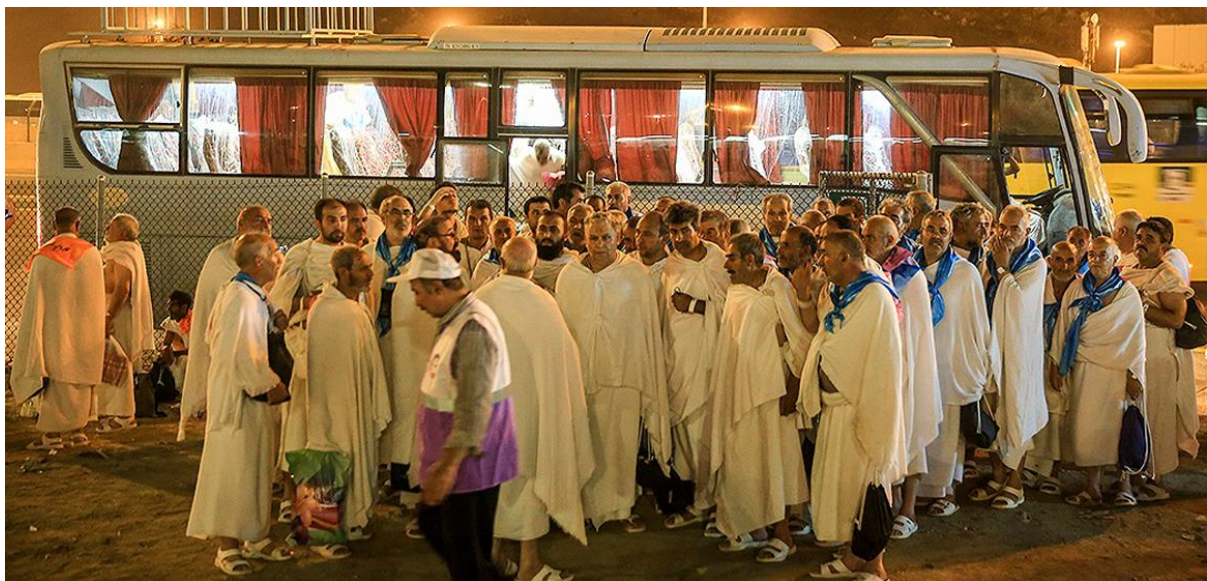
Pererinion yn symud i Muzdalifah

Yna, mae'r Hajj yn symud i Wastadedd Arafat. Mae hyn yn yr anialwch lle mae Mwslimiaid yn gofyn i Dduw am faddeuant. Fe'i gelwir y " mynydd trugaredd ". Dyma lle y pregethodd Muhammad, sef y proffwyd yn Islam, ei bregeth olaf. Mae hon yn rhan bwysig iawn o Hajj. Bydd pererinion yn sefyll o ganol dydd i fachlud haul gan estyn allan at Allah, eu Duw, gan deimlo ei bresenoldeb. Wedyn, mae'r Pererinion yn symud i Muzdalifah, lle caregog garw lle maent yn bwyta ac yn casglu cerrig ar gyfer gweithgareddau'r diwrnod canlynol.