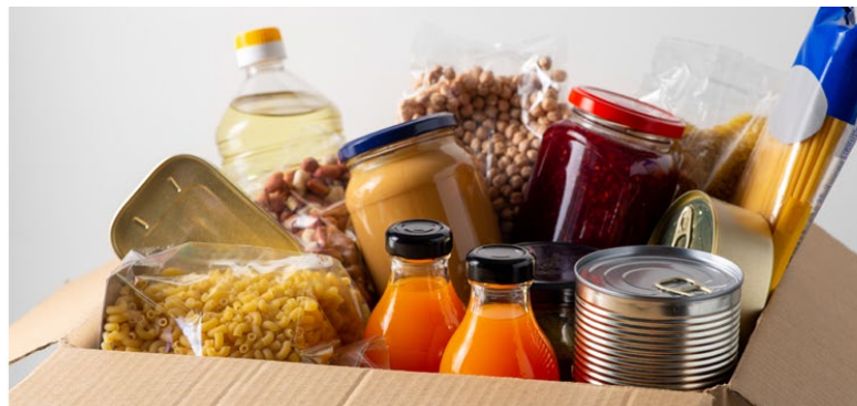
Parsel Banc Bwyd.

Yn aml, mae'r canfyddiad o dlodi yn cael ei ystyried fel rhywbeth llawer gwaeth, megis rhyfel, sychder neu newyn oherwydd fe'i gwelir mewn gwledydd sy'n datblygu, ond mae tlodi yn real iawn yma yng Nghymru hefyd. Yn arolwg diweddaraf Llywodraeth Cymru, cofnodwyd bod 2% o bobl yn dweud eu bod wedi derbyn bwyd o fanc bwyd yn y 12 mis diwethaf oherwydd diffyg arian, a dywedodd 1% pellach o bobl y byddent wedi hoffi derbyn bwyd o fanc bwyd ond nad oeddent oherwydd eu bod yn cael trafferth gydag incwm ac arian. Er bod yr ystadegau hyn yn ymddangos yn isel ar yr olwg gyntaf, mae 3% o boblogaeth Cymru yn 90,000 o bobl, ac felly mae hyn yn amlygu'r problemau tlodi a brofir yma.