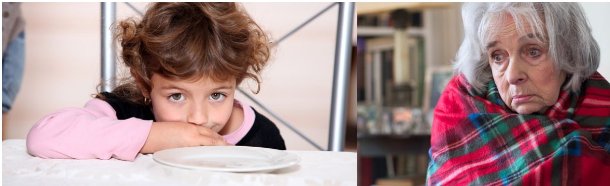
Plentyn heb fwyd i'w fwyta. / Person yn dioddef tlodi tanwydd, wedi ei lapio mewn blanced.

Mewn cyfnod lle mae costau byw yn cynyddu'n barhaus yma yng Nghymru, lle mae eitemau bob dydd yn fwy a mwy anodd i'w prynu a theuluoedd sy'n gweithio yn gorfod troi at fanciau bwyd, ymddengys ei bod yn amser arwyddocaol i ofyn y cwestiwn; "Pam fod tlodi yn bodoli?". I ddechrau, y diffiniad o dlodi yw cyflwr lle mae person neu grŵp o bobl â diffyg annibyniaeth ac adnoddau ariannol ar gyfer safon byw gofynnol. Mae lefel incwm o gyflogaeth mor isel o'i gymharu â chostau byw fel na ellir diwallu anghenion dynol sylfaenol. Mae enghreifftiau o dlodi yn cynnwys methu â rhoi'r gwres ymlaen mewn cartrefi, methu â rhoi bwyd ar y bwrdd, neu hyd yn oed digartrefedd.