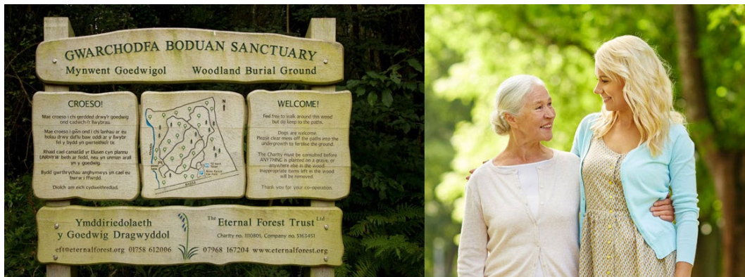
Arwydd Gwarchodfa Boduan Sanctuary Mynwent Goedwigol.

"Diolch o galon am eich caredigrwydd a'ch cydymdeimlad ... Rydych wedi creu rhywbeth arbennig ac rwy'n siŵr y daw â heddwch i lawer o bobl am genedlaethau."