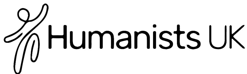
Logo Dyneiddwyr Cymru / Humanists UK