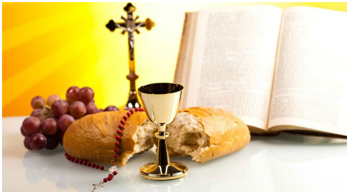
Gwin cymun a bara cymun, yn cynrychioli corff a gwaed Iesu Grist.

marwolaeth. Mae credoau Cristion ar fywyd ar ôl marwolaeth yn dod o atgyfodiad Iesu. Mae Cristnogion yn credu bod atgyfodiad Iesu yn rhan o gynllun sanctaidd Duw i ni fel bodau dynol sy'n byw ar Ei ddaear ef. Fel bodau dynol, gallwn bechu a chreu drygioni yn aml, felly roedd rhaid i Iesu dalu'r pris am ein drygioni. Fe wnaeth y trobwynt hwn alluogi i berthynas Duw gyda dynolryw gael ei hadfer. Ar ôl croesholiad yr Iesu, atgyfodwyd Iesu gan Dduw sydd wedi dod yn symbol am Ei aberth a sut wnaeth Ef orchfygu pechod a marwolaeth. Er ein bod wedi'n condemnio i farwolaeth fel bodau meidrol, bydd y rhai sy'n credu yn yr Iesu ac yn byw bywydau moesol yn cael bywyd tragwyddol yn y Nefoedd.