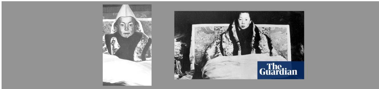
Lluniau o'r Dalai Lama