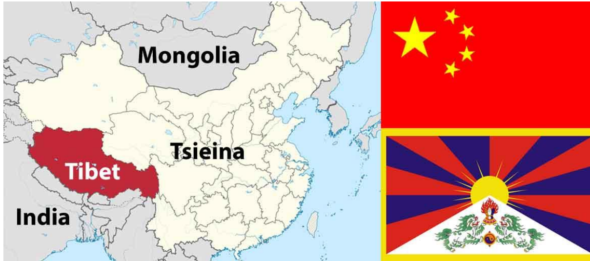
Map yn dangos lleoliad Tibet | Baner Tsieina (uchod) ag Tibet (isod)

rheolaeth gynyddol China ond cafodd yr ymdrech ei chwalu gan fyddin China a bu farw miloedd. Fel arweinydd naturiol y wlad bu'n rhaid i'r Dalai Lama ffoi o Tibet ac aeth ef a nifer mawr o'i ddilynwyr dros y ffin i India. Cawsant groeso gan arweinwyr India ac fe wnaeth y ffoaduriaid greu cymdeithas a roddodd barch i iaith, diwylliant a chrefydd Tibet.