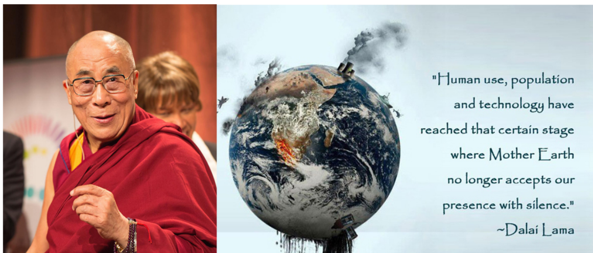
Y Dalai Lama

Dyma ychydig o bwyntiau sy'n adlewyrchu safbwyntiau Bwdhyddion heddiw am rôl dynoliaeth fel stiwardiaid.